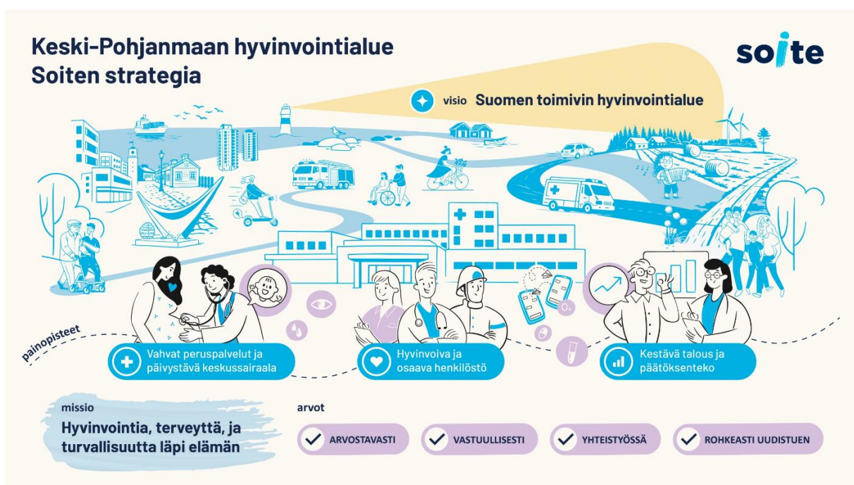
Kuva 3. Keski-Pohjanmaan hyvinvointialueen strategia 2026-2029.

Keski-Pohjanmaan hyvinvointialueella opiskeluhoillon psykologi- ja kuraattoripalvelut sekä koulu- ja opiskeluterveydenhuolto sijoittuvat Sote-keskukseen. Keskeisenä toimintaa ohjaavana ajatuksena on lasten, nuorten, perheiden ja aikuisten terveyden, hyvinvoinnin ja osallisuuden edistäminen laadukkailla, joustavilla ja moniammatillisilla palveluilla yhteistyössä yksilöiden, perheiden ja heidän läheistensä kanssa.